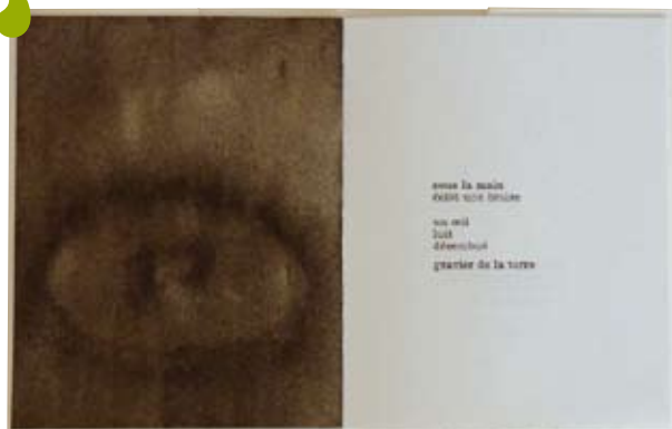
La cage des pierres, livre.