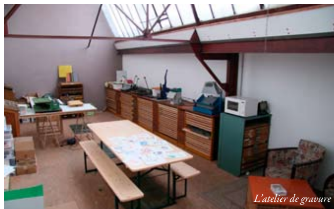
L'atelier de gravure

Important : Avant de venir, préparer votre illustration sur papier (taille qui s'inscrit dans un format de 15 x 21 cm) ainsi que le court texte que vous souhaitez associer à votre image.